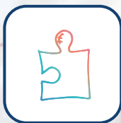
Oficinas de Suporte