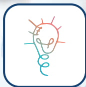
Oficina Criativa de Soluções