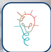
Oficina Criativa de Soluções