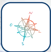
Projeto de Vida