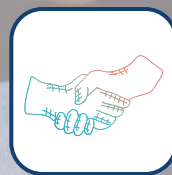
Apoio à Empregabilidade